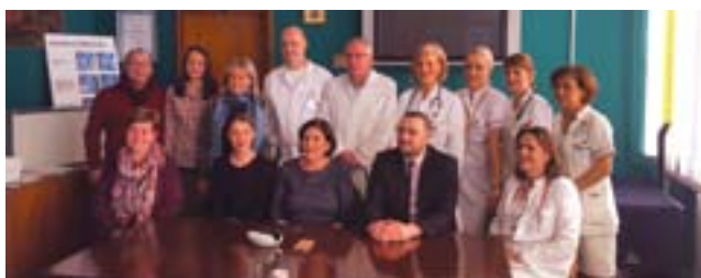
Univerzitetski klinički centar u Tuzli

Zbog svega toga, profesionalni razvoj medicinskog osoblja podrazumijeva superviziju koja je neophodna u procesu cjeloživotnog obrazovanja.